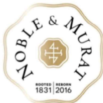
Porto LBV 2012